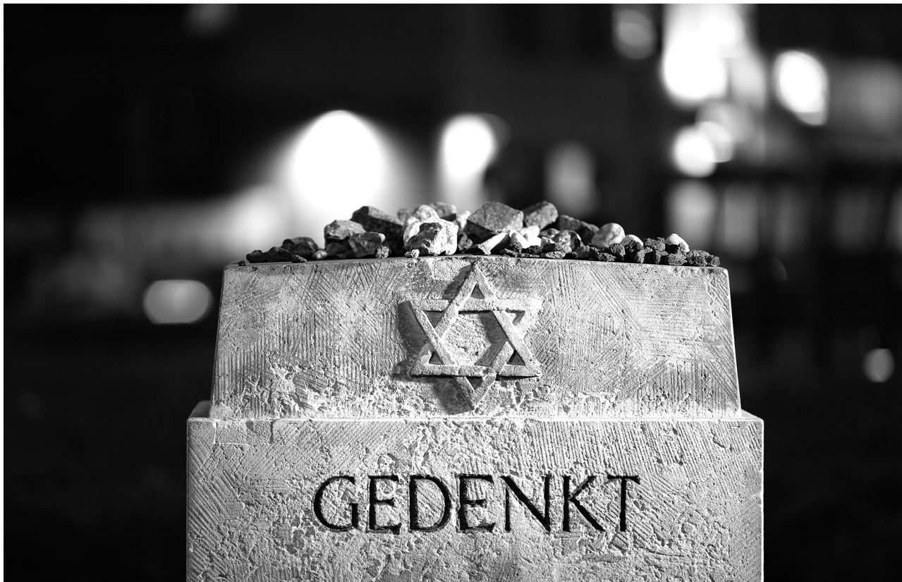
Gedenkstein für die während der Pogromnacht im November 1938 zerstörte Synagoge in Leipzig

Die antisemitischen Angriffe, die wir in der Öffentlichkeit ertragen mussten, waren entsetzlich, aber sie schweißten uns jüdische Schülerinnen und Schüler auch zusammen. Bevor ich 1938 auf die Schule in Berlin-Mitte wechseln konnte, war ich der einzige jüdische Junge in der Klasse einer normalen Volksschule in der Sonnenallee in Neukölln. Weil ich jüdisch erzogen wurde – mein Vater war Jude und meine Mutter eine nichtreligiöse Christin – musste ich den Judestern tragen und den Namen »Israel« annehmen. Schon als sechsjährige Erstklässler hatten meine Mitschüler durch ihre Elternhäuser den Antisemitismus eingepflicht bekommen, ich war ausgegrenzt aus der Klassengemeinschaft, galt